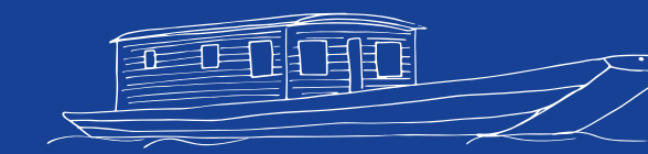
Retrouvez tous nos bons plans www.loireavelo.fr/nos-bonnes-idees