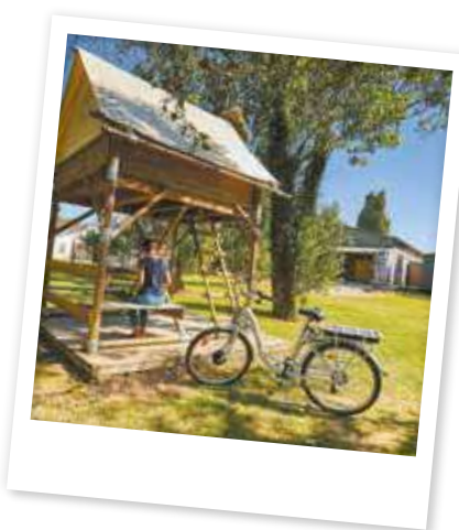
Retrouvez les établissements www.loireavelo.fr/services-velo