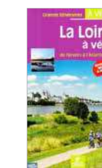
Guide Chamina La Loire à Vélo - 2020