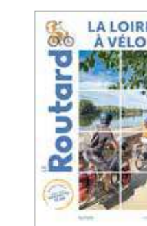
Guide du Routard La Loire à Vélo - 2021