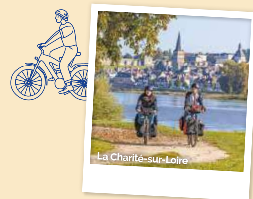
Retrouvez les lieux www.loireavelo.fr/services-velo/parkings-voitures-longue-duree

Vous recherchez une solution pour stationner votre voiture pendant votre périple sur La Loire à Vélo ?