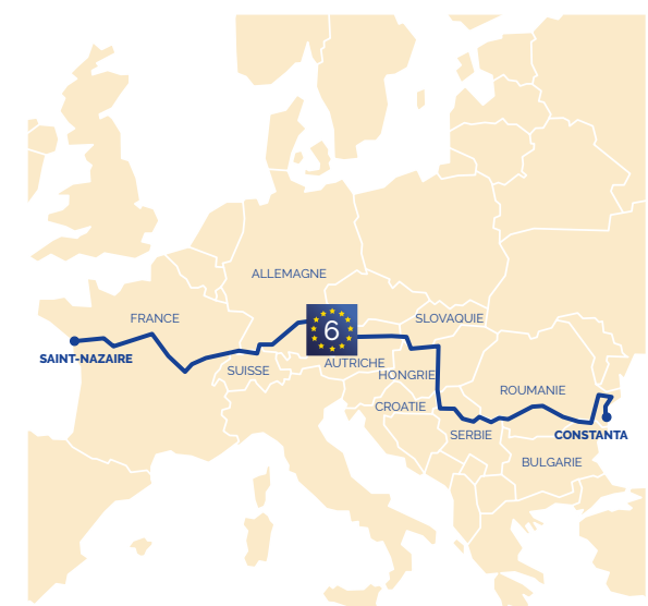
Infos sur : www.eurovelo.com/ev6

En France, après Cuffy, l'EV6 poursuit sa route à travers les régions Bourgogne-Franche Comté et Grand-Est, de Nevers jusqu'à Bâle-Mulhouse.